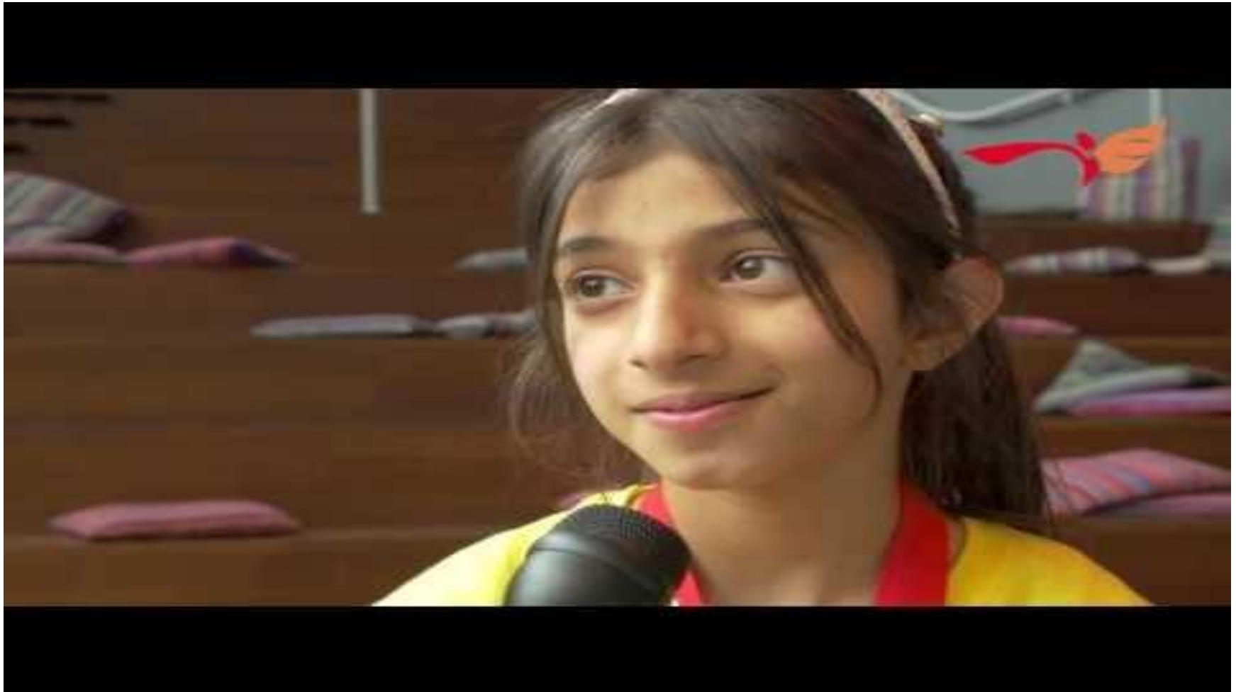
Project Eigen-Wijs: Sprankelijk slotconcert (korte versie 1)