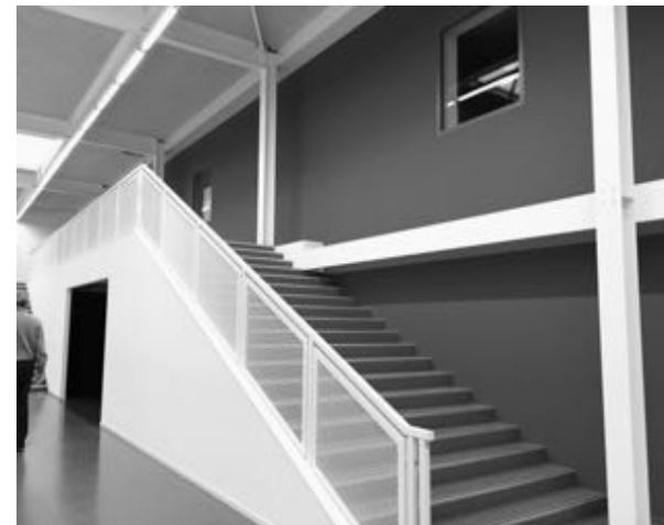
Hulskamp Audiovisueel (DreamDoc) Inmoov Explorer Project (robot) E-Nable (prothese-hand, in de cave bij laptop)