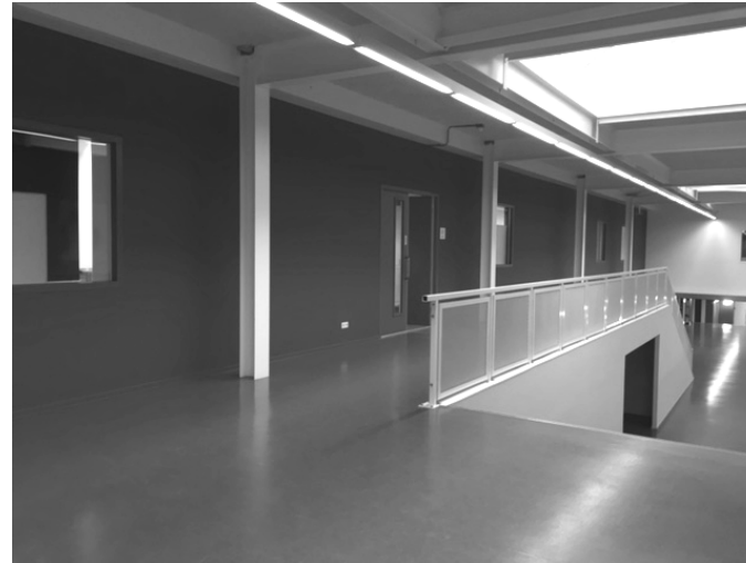
PelserHartman Daan de Haan Design