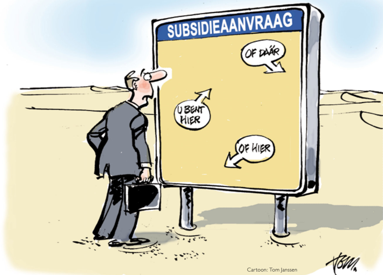
Cartoon: Tom Janssen