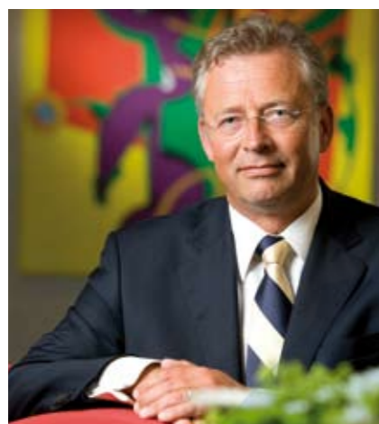
Paul de Krom is staatssecretaris van Sociale Zaken en Werkgelegenheid