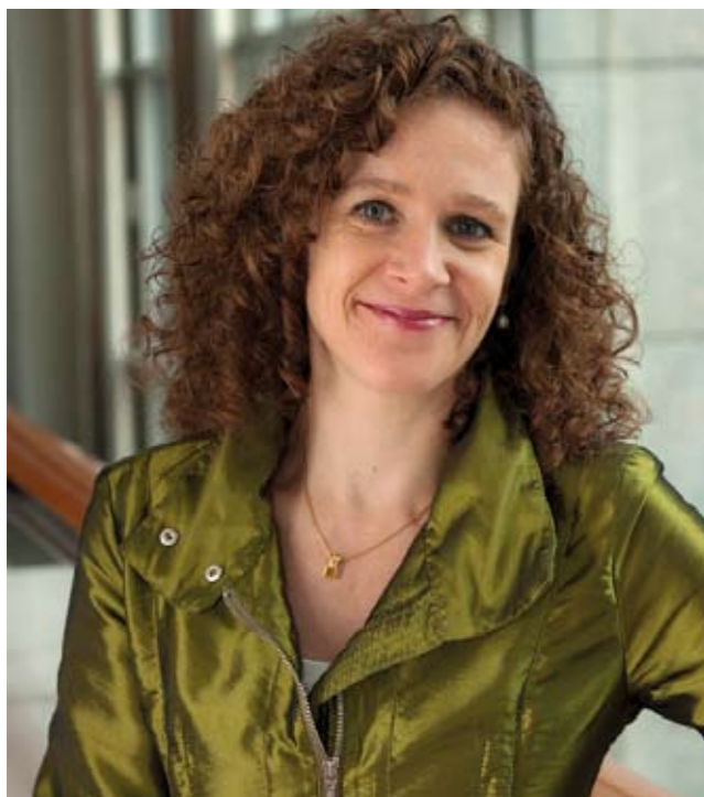
Sophie in 't Veld is Europarlementariër voor D66 in de Alliantie van Liberalen en Democraten voor Europa.